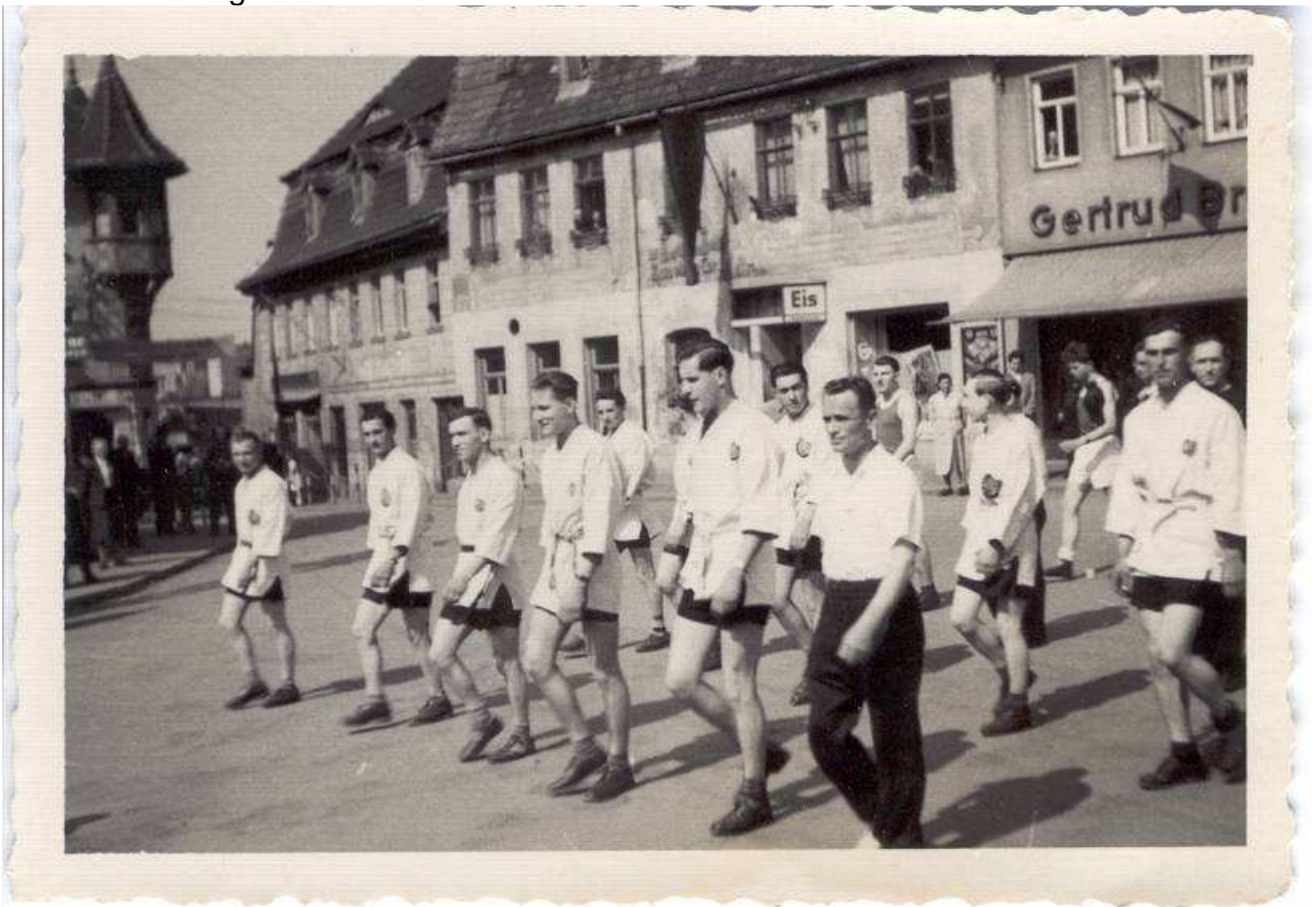
1. Mai 1952